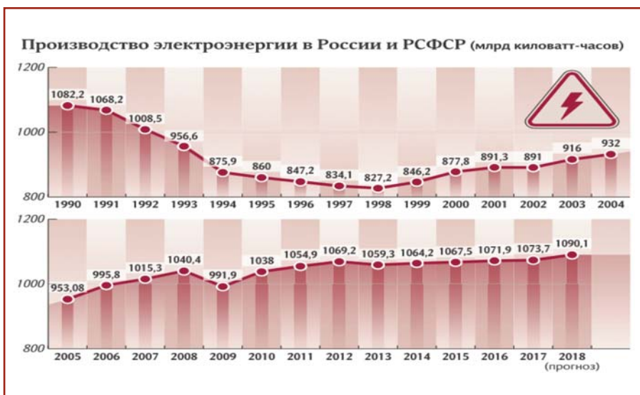
Рис. 2. Электроэнергетика РФ в 1992 – 2018 гг.

ки. При этом Правила требуют, чтобы субъекты электроэнергетики, переходя на стратегию ТОиР по техническому состоянию оборудования, регламентировали свои действия Локальными нормативными актами (ЛНА), разрабатываемыми в соответствии с Правилами.