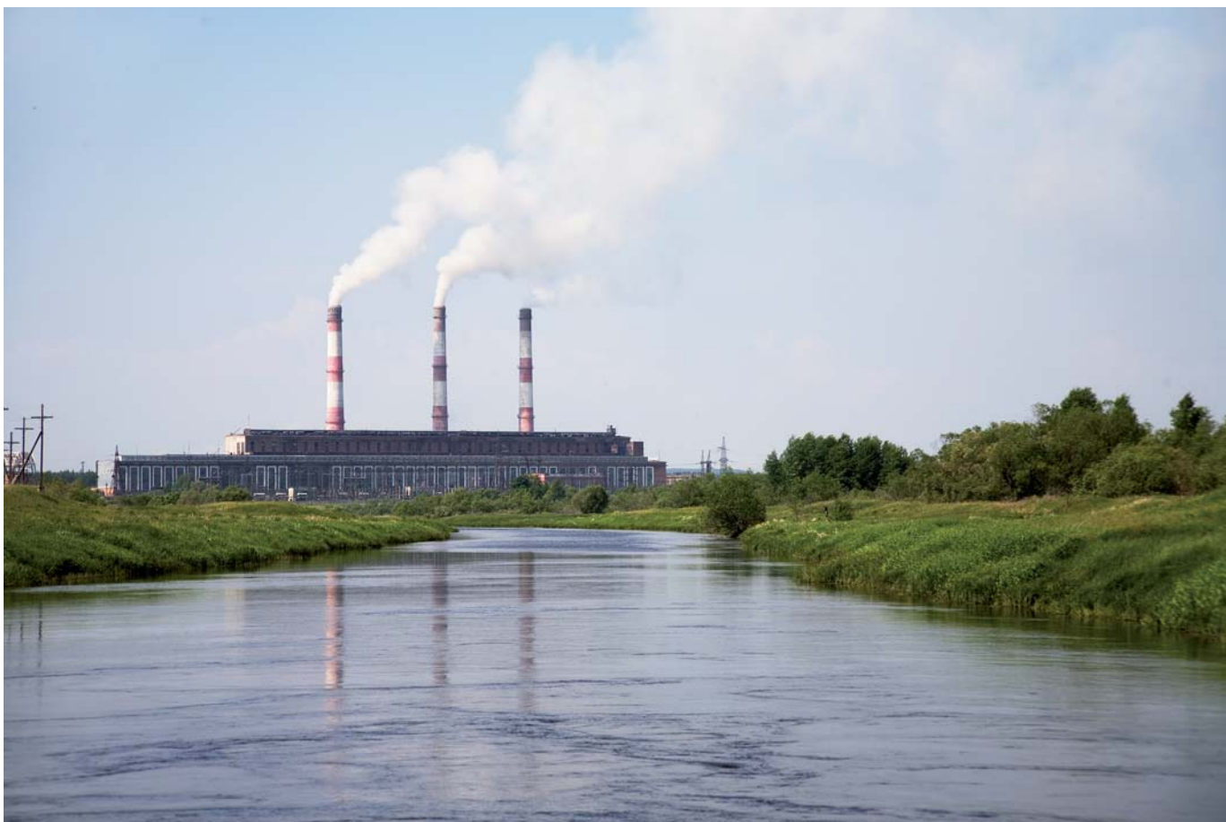
Серовская ГРЭС со стороны водоканала. 2008 г.

У моих родителей первая запись в трудовой книжке — строительство уральской электростанции, хотя мама из Орловской области, а папа — из Брянской, но встретились они здесь, в городе Серове. Оба приехали за лучшей жизнью. В то время создавалось много семей, а жилья на всех не хватало, поэтому строительство шло ударными темпами сразу в двух местах: рыли котлованы и заливали фундамент на станции, возводили жилые дома и социальные объекты в посёлке. Все построенные больницы, детские сады, школы — дело рук строителей Серовской ГРЭС.