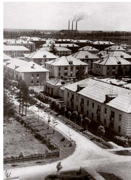
Благоустроенный жилой посёлок Энергетиков жилой площадью 35 000 м 2 . 1964 г.