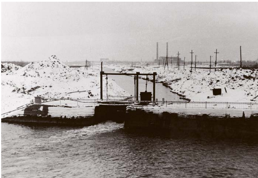
Серовская ГРЭС со стороны плотины, две трубы. Вторая половина 1950-х годов